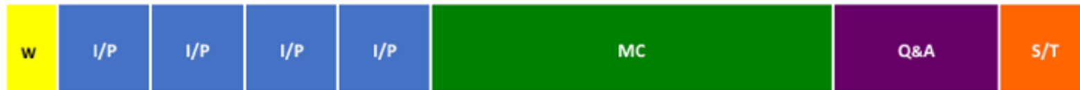
Initial Remarks Style